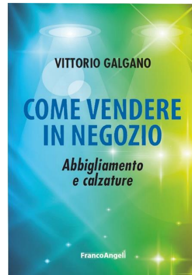
“Come Vendere in Negozio” Ed. FrancoAngeli