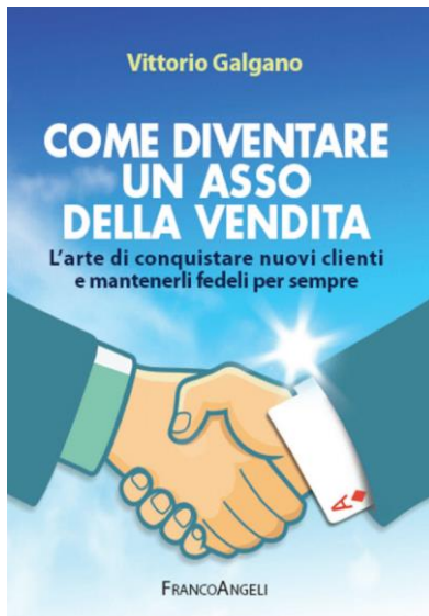
“Come diventare un Asso della Vendita” Ed. FrancoAngeli